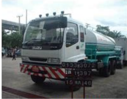
รถบรรทุกวัสดุอันตราย