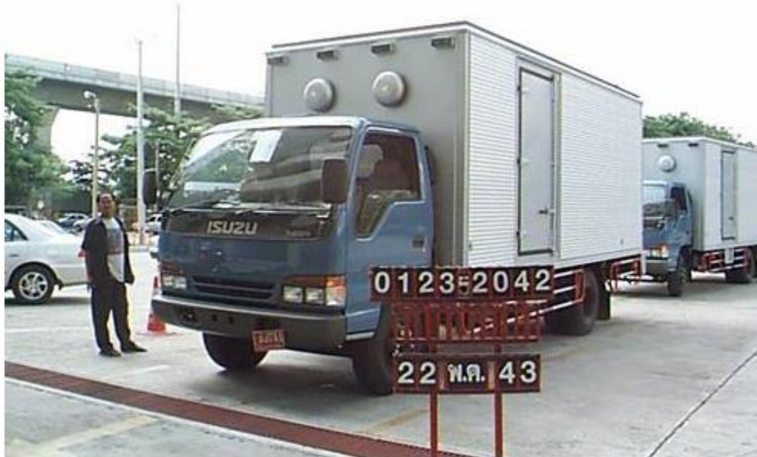
รถตู้บรรทุก