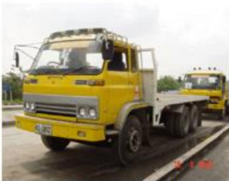
กระบะบรรทุกพื้นเรียบ