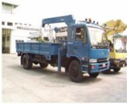
กระบะบะบรจทุก