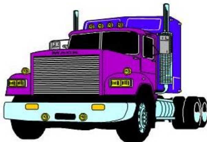
รถลากจูง