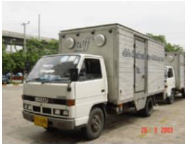
รถตู้บรรทุก