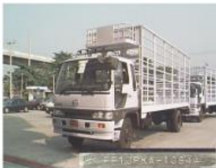
กระบะบรรทุก