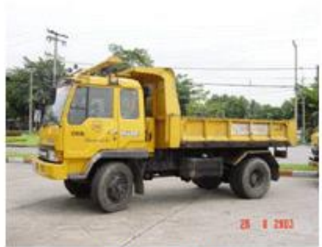
กระบะบรรทุกยกเท