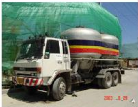
รถบรรทุกปูนซีเมนต์ผง