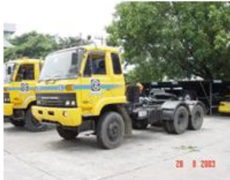
รถลากจูง