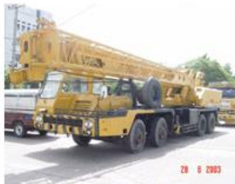
รถบรรทุกเครื่องทุ่นแรง