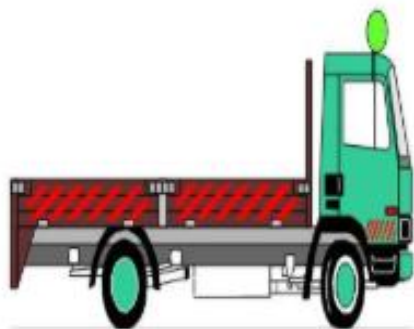
กระบะบะบรจทุก