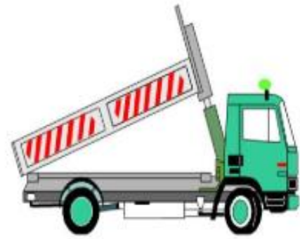
กระบะบะบรจทุกยกเท