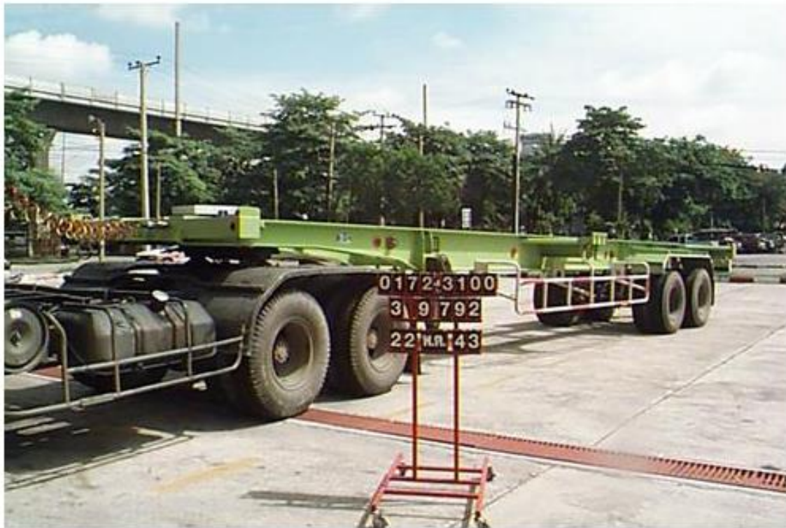
รถกึ่งพ่วง