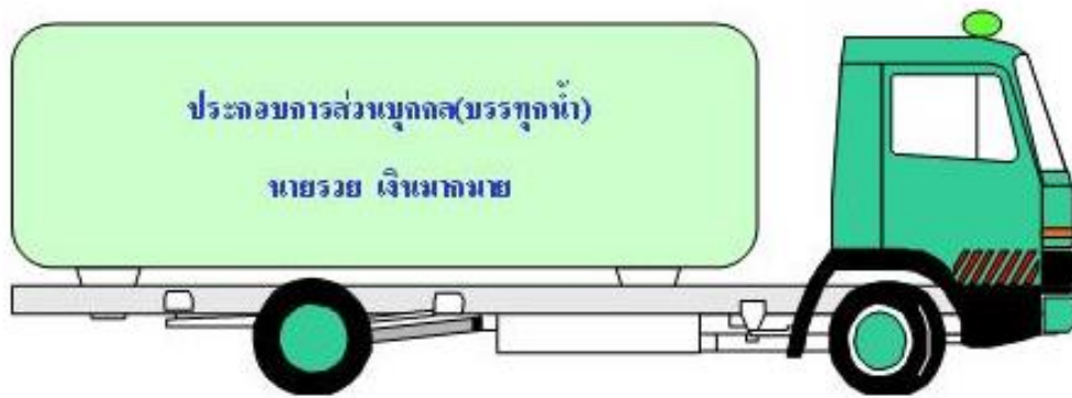
รถบรรทุกของเหลว