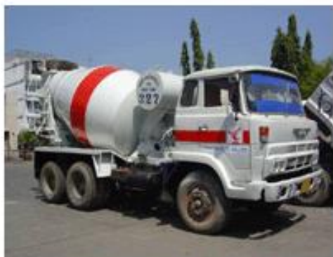
รถบรรทุกถังผสมคอนกรีต