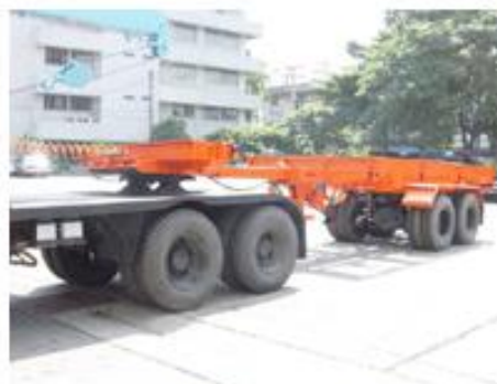
รถกึ่งพ่วงบรรทุกวัสดุยาว