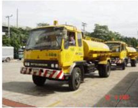
รถบรรทุกของเหลว