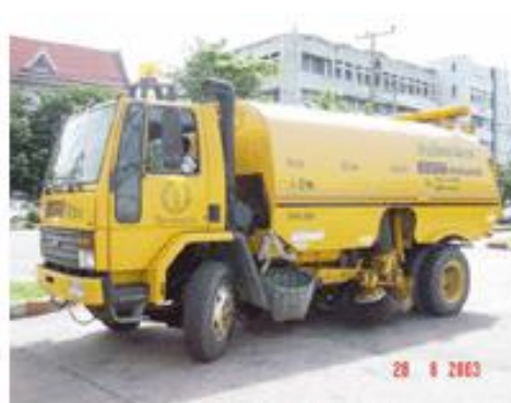
รถดูดฝุ่นและกวาดถนน