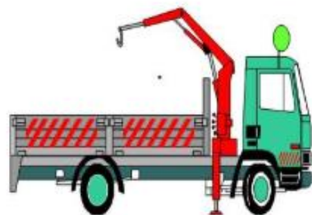
กระบะบะบรจทุก