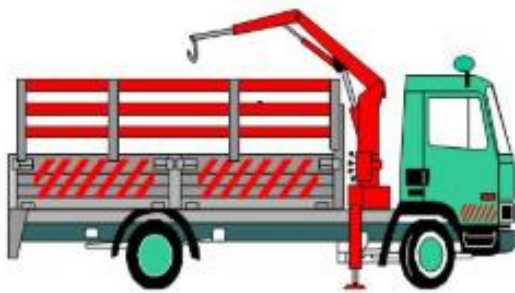
กระบะบะบรจทุก