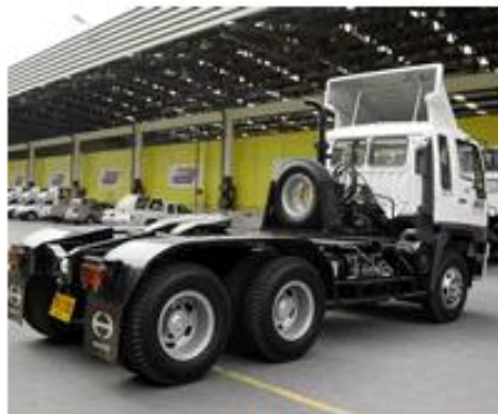
รถลากจูง