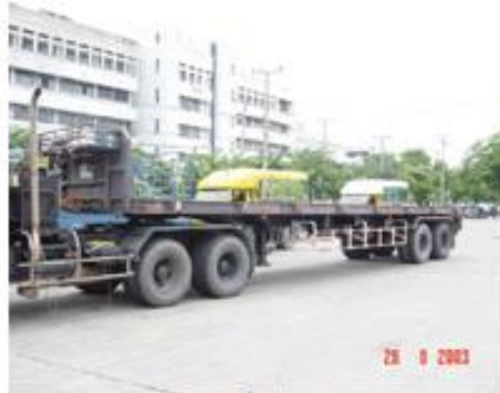
รถกึ่งพ่วง