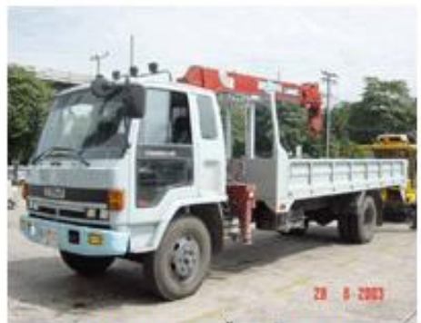
กระบะบรรทุกติดตั้งเครื่องทุ่นแรง