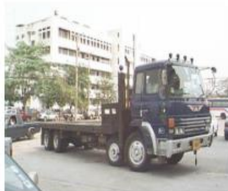
กระบะบรรทุก