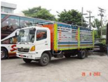
กระบะบรรทุกมีข้างเสริม